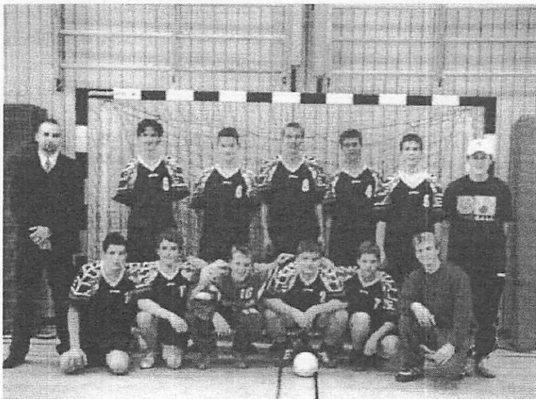
Bezirksligameister 2004 ??????