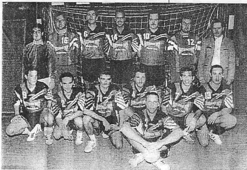
Münchner Merkur/Fürstenfeldbrucker Tagblatt vom 19.11.1996