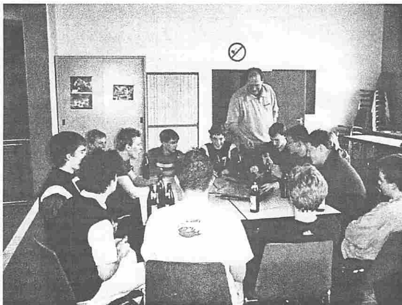
Abschluss nach einer erfolgreichen Saison